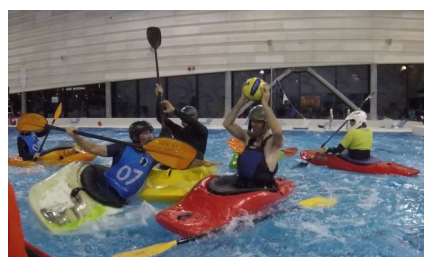
Kayak-polo au Centre Jean-Claude Malépart

L'activité de kayak-polo était divisée en deux ligues (ligues A et B)