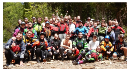
Sortie à Pont-Rouge en juin 2019

Pour une deuxième année, le CCKEVM a poursuivi son programme de parrainage, qui permet aux kayakistes moins expérimentés de recevoir un soutien durable par des pairs plus aguerris. Au total, ce sont 16 kayakistes expérimentés qui se sont portés volontaires pour être parrains/marraines afin d'accompagner les nouveaux kayakistes et les kayakistes moins confiants dans leur cheminement. Plusieurs parrains/marraines ont ainsi pu conseiller et accompagner des kayakistes moins expérimentés au cours de l'été. En bout de course, on estime que 13 kayakistes ont pu bénéficier des conseils d'un ou de plusieurs parrains/marraines via ce programme cet été.