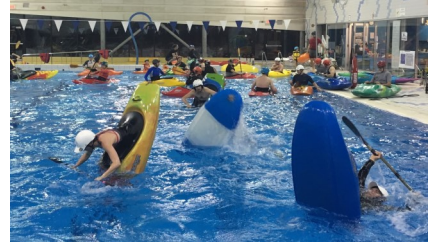
Pratique libre en piscine

de la piscine. Selon les inscriptions à l'accueil, on estime qu'environ 415 personnes ont participé aux pratiques libres en piscine, avec en moyenne 32