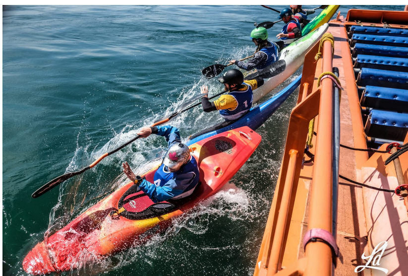
Départ du Boatercross 2019

Le CCKEVM et les membres organisateurs du MEV tiennent à souligner la précieuse implication des nombreux bénévoles qui ont permis le succès de l'événement.