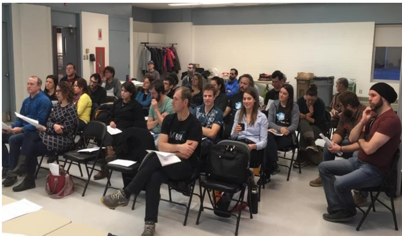
Assemblée Générale 2018

Il y a eu 394 membres en règle en 2019, ce qui représente une hausse de 6% par rapport à 2018. Pour une cinquième année, les cartes de membres ont été produites en coopération avec la fédération Eau Vive Québec, réduisant ainsi les coûts administratifs et l'impact écologique.