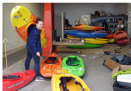
Atelier de réparation de la flotte

Avec l'achat du nouveau matériel, nous prévoyons trier notre équipement pour éliminer le matériel désuet.